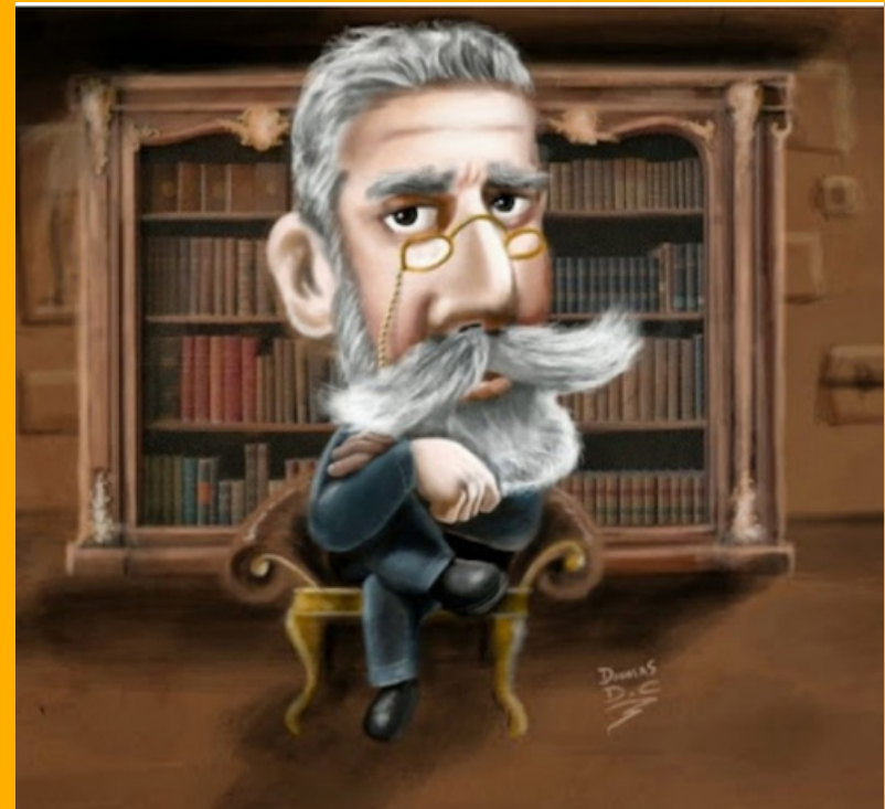
Machado de Assis